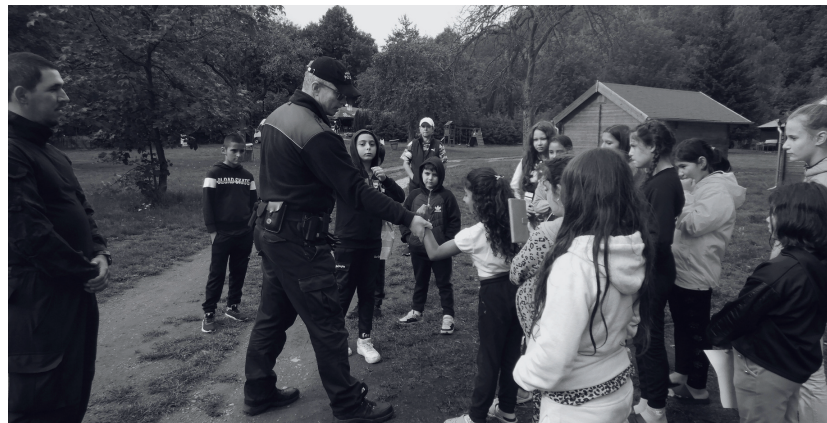
PREVENTIVNÍ BESEDA S MĚSTSKOU POLICIÍ