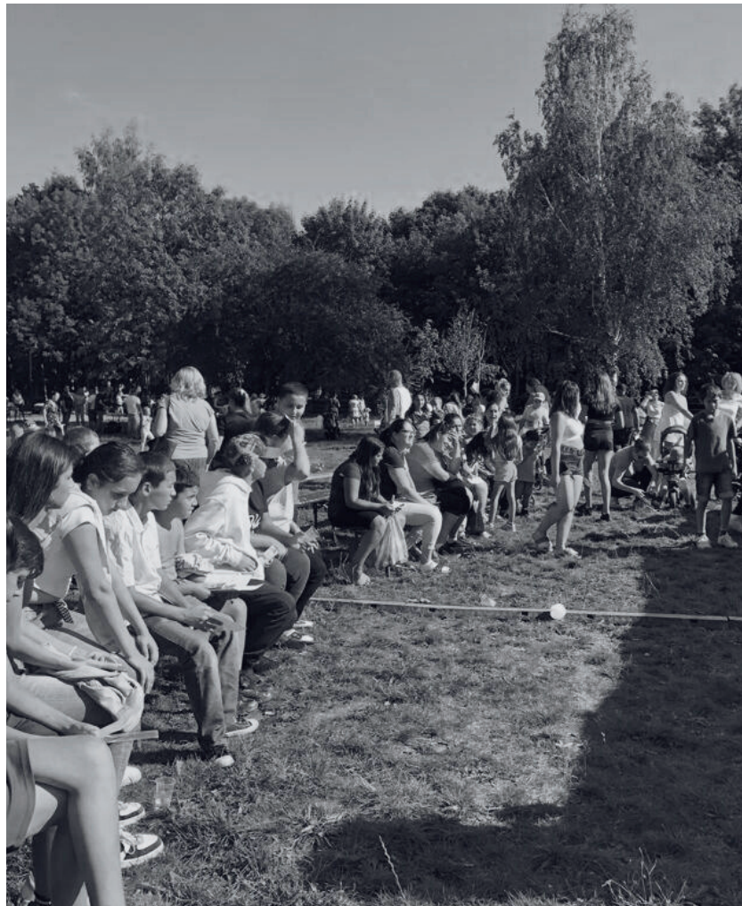
AKCE VIDĚN V ULICÍCH S PODPOROU MĚSTA JIRKOV