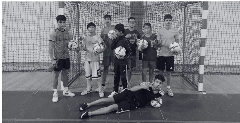
VÍTĚZNÝ TÝM POULIČNÍ LIGY V KADANI

Letošní ročník pouliční fotbalové ligy proběhl za finanční podpory města Kadaň a měl rekordní účast (69 hráčů, 40 diváků). Dalším úspěšným projektem byl preventivní pobyt realizovaný prostřednictvím finanční podpory Ministerstva vnitra a města Kadaň. Preventivní pobyt se uskutečnil v autokempu Prunéřov pro 20 dětí ze sociálně vyloučených lokalit v Kadani a Prunéřově. Prostřednictvím tohoto projektu měli klienti možnost kvalitního trávení volného času díky výletům do ZOO v Chomutově a Techmanie v Plzni. Pobyt byl zaměřen ale i na preventivní aktivity – beseda s MP, preventivní aktivity zaměřené na závislostní chování. Samozřejmostí byly volnočasové aktivity, které pomáhaly stmelovat účastníky po celý průběh pobytu. Projekt hodnotíme pozitivně a přínosně jak z hlediska výstupu samotného pobytu, tak pro další navazující práci s cílovou skupinou.